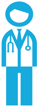
Médecins de ville