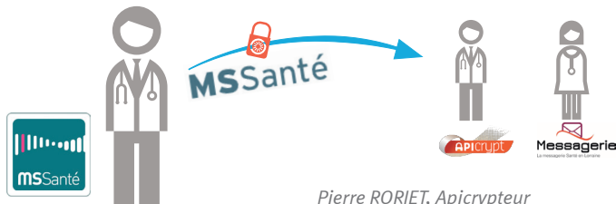
Bernard BRIOT utilisateur MSSanté

* soit la labellisation et l'interpolation des solutions de messageries pour permettre les échanges dans «un espace sécurisé».